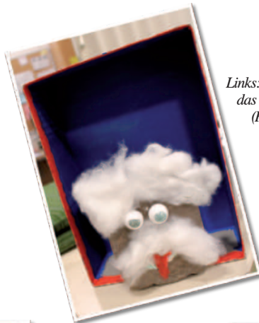
Links: Albert „Ein Stein“ Einstein, das Maskottchen unserer Konfi-Gruppe